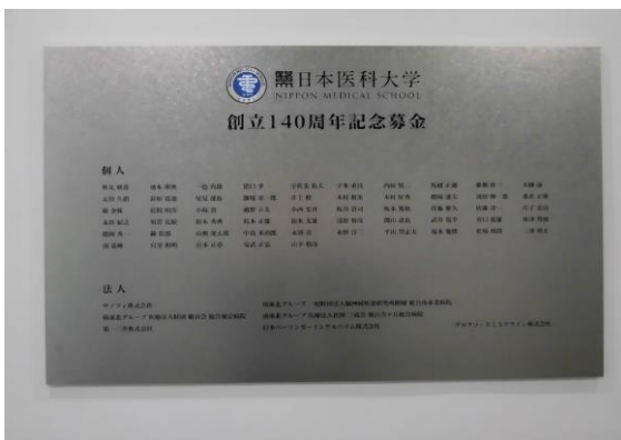
創立140周年記念募金銘板

日本医科大学創立140周年記念募金は、2016年4月より募集を開始し、2023年10月31日をもって約7年半にわたる募金期間を終了いたしました。この間、同窓生、在学生ご父母、教職員等本学関係者、日頃お世話になっております法人・団体等、多くの皆様からご支援を賜り2億6970万3500円ものご寄付を頂戴することができました。有難くご報告申し上げますとともに、ご協力を賜りました皆様に厚く御礼申し上げます。賜りましたご厚志は、教育・研究の充実、医療環境の充実、各施設の新・改築等施設整備に有効に活用させていただきます。また、教育棟1階入口付近に、寄付者銘板を掲出いたしました。末永く顕彰させていただきます。引き続き、本学の発展にご理解とご賛同をいただき、これまで以上にご支援とご協力を賜りますよう心からお願い申し上げます。