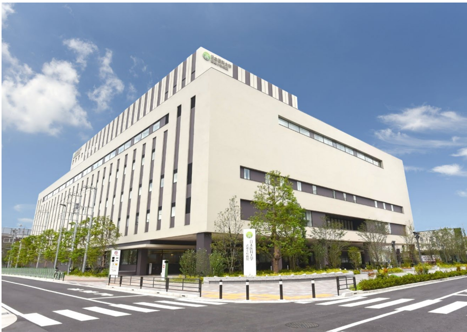
武蔵小杉病院外観

武蔵小杉キャンパス再開発募金は、2019年4月より募集を開始し、2023年10月31日をもって約4年半にわたる募金期間を終了いたしました。この間、同窓生、在学生ご父母、教職員等本学関係者、日頃お世話になっております法人・団体等、多くの皆様からご支援を賜り1億5107万6020円ものご寄付を頂戴することができました。有難くご報告申し上げますとともに、ご協力を賜りました皆様に厚く御礼申し上げます。おかげさまで、2021年9月1日新病院オープンから昨秋に2周年を迎え、最新の医療機器を導入し地域の中核病院としての役割を担っております。また1階エレベーターホール付近に掲出しました寄付者銘板につきましても更新し、2022年9月以降にご寄付いただいた皆様のご芳名を新たに追加させていただきました。末永く顕彰させていただきます。